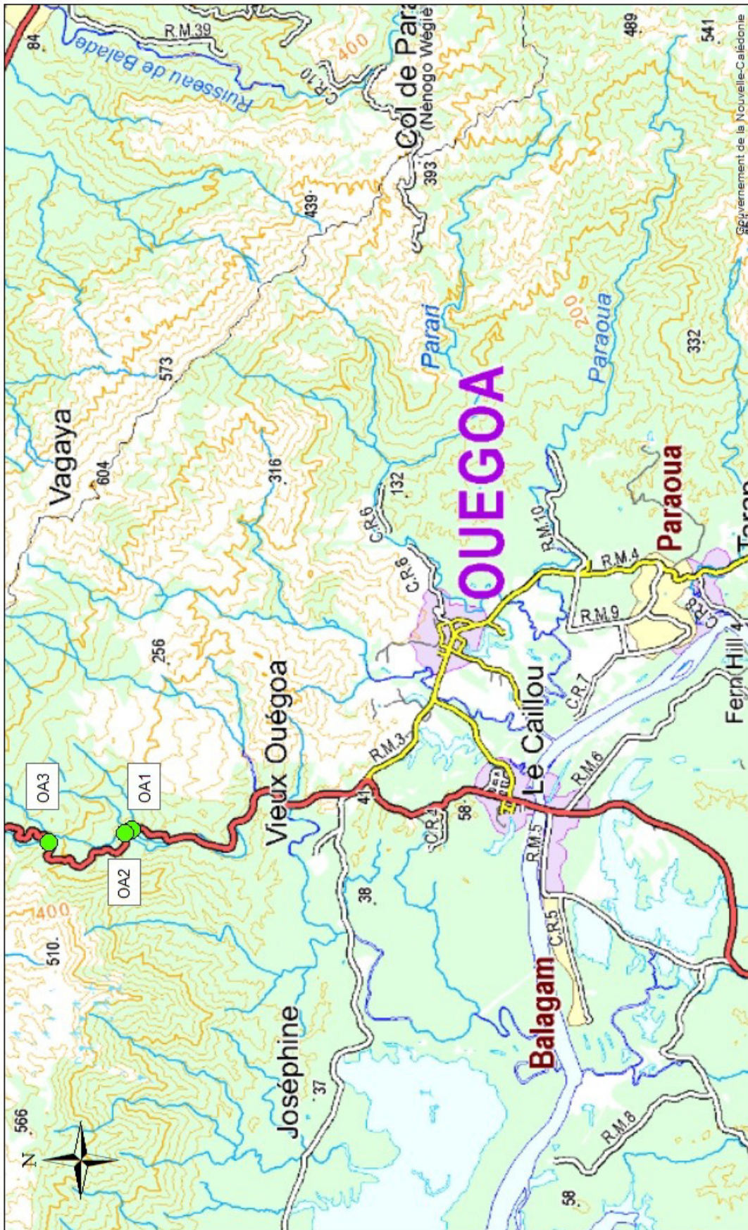
Plan de situation 3 ouvrages de franchissement Commune de Ouégoa